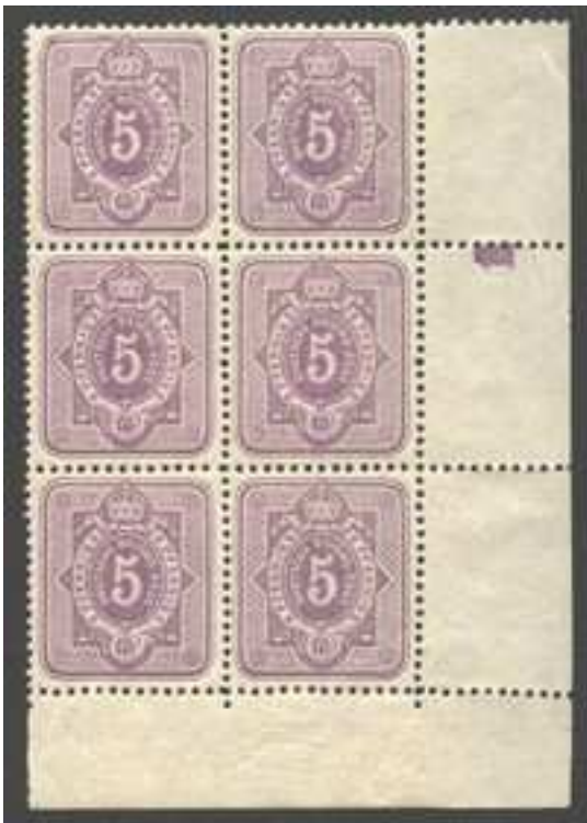
40 I,PI.Nr.1 liegend