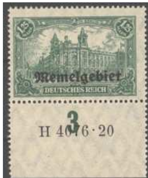
HAN + PF der Urmarke