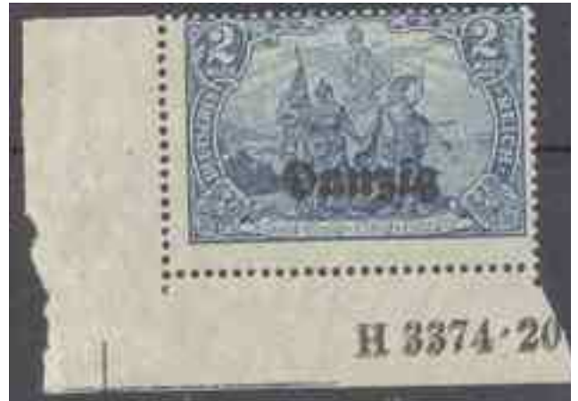
11aDD,Eckrand mit HAN