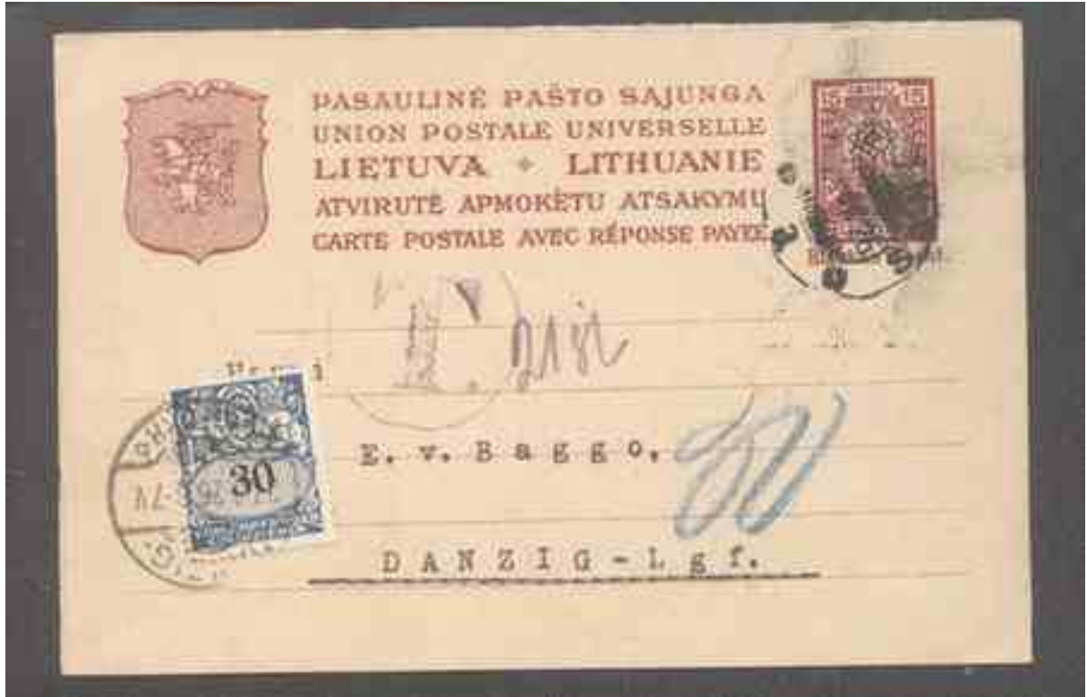
Ganzsache mit 33 PF II

xx = postfrisch x = ungebraucht mit sauberen Falz o = gestempelt gep.= geprüft BPP