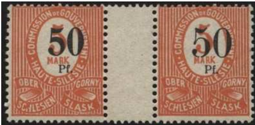
12a,ZW 4,dabei PF IX,xx

xx = postfrisch x = ungebraucht mit sauberen Falz o = gestempelt gep.= geprüft BPP